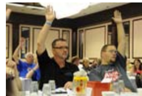
I soci del Kiwanis e dell'Aktion Club partecipano insieme alle attività della sessione di chiusura.

Trova altre foto della conferenza sul sito Aktion Club Flickr.