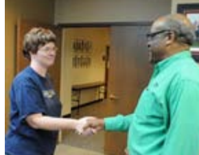
Un membro deell'Aktion Club incontra il Presidente Internazionale del Kiwanis International Sylvester Neal.