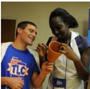
Soci dell'Aktion Club e del CKI lavorano insieme in un'attività di service per il progetto. Eliminate.

Aktion Club (informazioni in lingua inglese) l'unico club di service per adulti disabili, con piu di 9.000 membri in tutto il mondo.