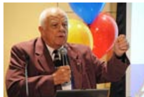
Il co-fondatore dell'Aktion Club introduce la sessione di apertura.