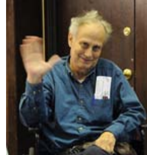
Un membro dell'Aktion Club arriva alla sezione di chiusura.