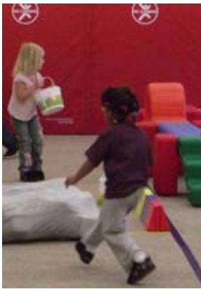
Bambini a caccia di uova di Pasqua e altri tesori.