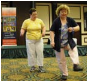
Gara di talenti: i partecipanti si esibiscono in una danza.

Australia. Il bus del Kiwanis trasporta persone anziane con disabili e altri gruppi che si recano nella zona di Adelaide.