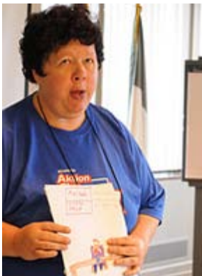
Un membro dell'Aktion Club descrive i suoi disegni.